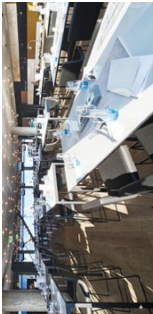
Premium Lounge im St. Jakob-Park